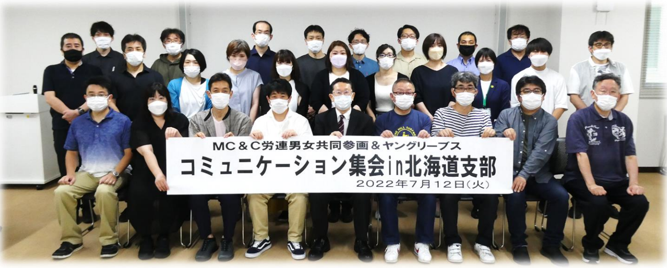
MC&C労連男女共同参画&ヤングリープスコミュニケーション集会を開催し、加盟組合執行委員の「顔合わせ心合わせ」をしました。 ～2022年7月12日(火)UAゼンセン北海道支部会議室にて撮影～